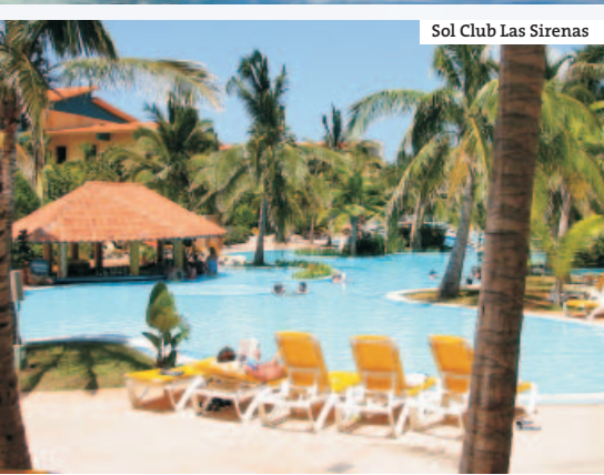
Sol Club Las Sirenas