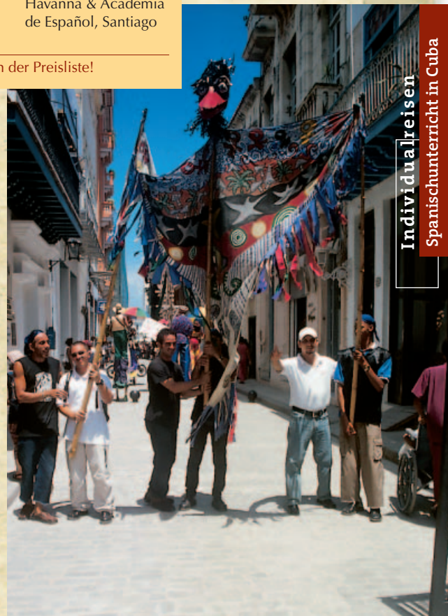
Individuelle Reisen Spanischunterricht in Cuba