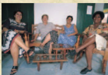
Lehrerinnen, Academia Máximo, Havanna

Der didaktische Aufbau der Kurse und die Unterrichtsmethodik ist mit denen der Academia Máximo, Havanna identisch. Themenspezifische Konversationskurse werden derzeit jedoch nicht angeboten. Die beiden Lehrwerke »Caminos« und »VEN« sind auch in der Academia de Español vorhanden. Dort können jedoch auch andere Lehrwerke zum Einsatz kommen.